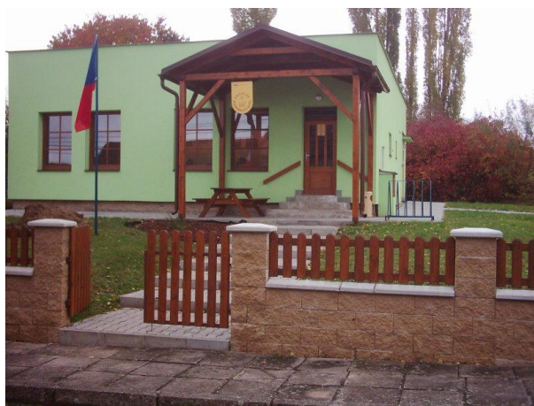
Dosavadní sídlo MAS POHODA venkova v obci Val u Dobrušky.

Celkové příjmy MAS pro první ucelený rok (2009) odhadujeme na 2,5 mil. Kč. Z toho však větší část budou tvořit osobní náklady (mzdy, odvody, odměny a náhrady).