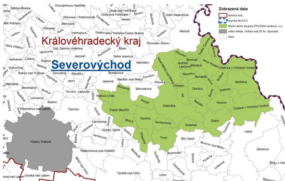
OBRÁZEK 1 ÚZEMNÍ PŮSOBNOST MAS POHODA VENKOVA

Bačetín, Bohdašín, Borová, Bystré, Česká Čermná, České Meziříčí, Deštné v Orlických horách, Dobré, Dobruška, Dobřany, Chlístov, Janov, Jestřebí, Kounov, Králova Lhota, Libchyně, Mezilesí, Mokré, Nové Město nad Metují, Nový Hrádek, Ohnišov, Olešnice v Orlických horách, Opočno, Podbřezí, Pohoří, Přepychy, Přibyslav, Rohenice, Sedloňov, Semechnice, Sendraž, Slavoňov, Sněžné, Trnov, Val.