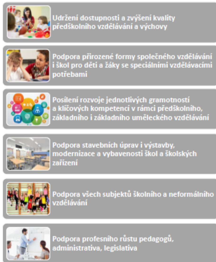
OBRÁZEK 4 PRIORITY VZDĚLÁVÁNÍ ÚZEMÍ SO ORP NOVÉ MĚSTO NAD METUJÍ

Definované priority vzdělávání dětí a žáků do 15 let na území SO ORP Nové Město nad Metují