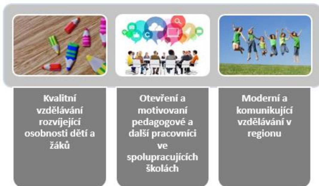
OBRÁZEK 3 PRIORITY VZDĚLÁVÁNÍ ÚZEMÍ SO ORP DOBRUŠKO

Definované priority vzdělávání dětí a žáků do 15 let na území SO ORP Dobruška