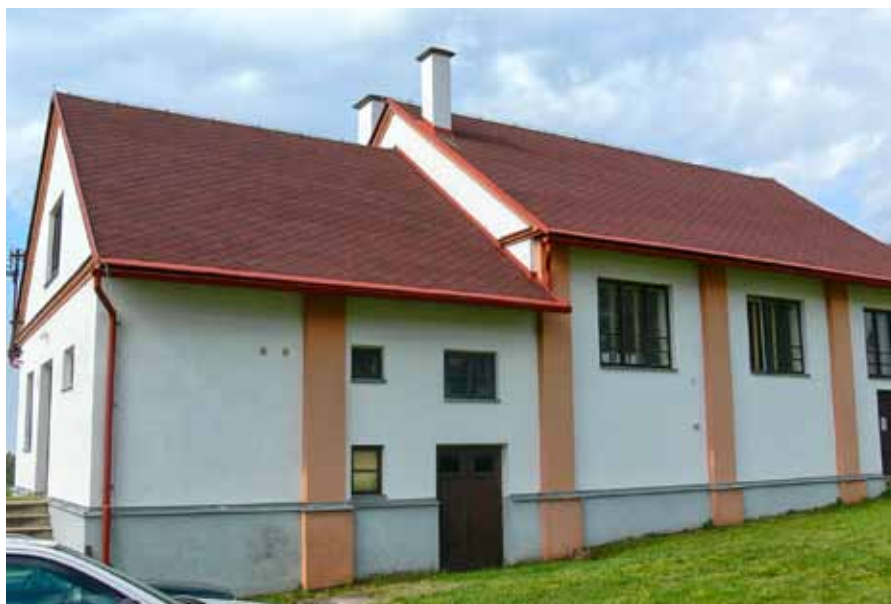
Dobřanský Sokol realizoval projekt Výměna střešní krytiny a zateplení stropu sálu budovy sokolovny v Dobřanech.