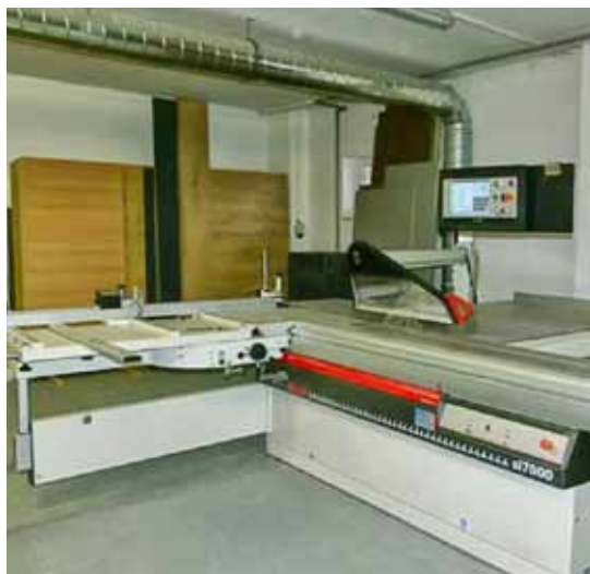
Pořízení strojního zařízení pro rozvoj podnikání, Jindřich Kratochvíl, Opočno.