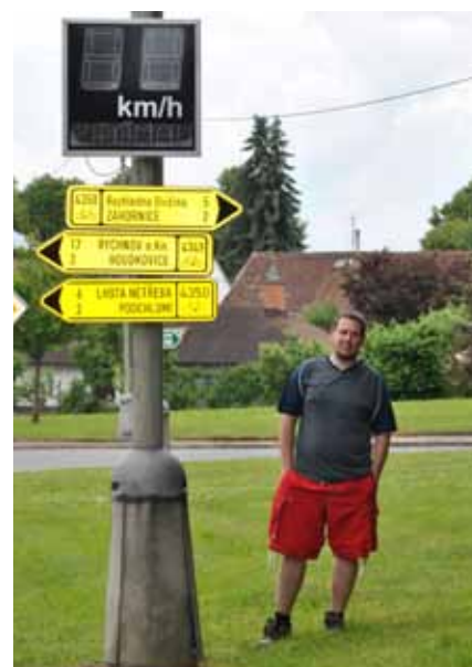
Obecní projekt Zajištění bezpečnosti chodců v Trnově.