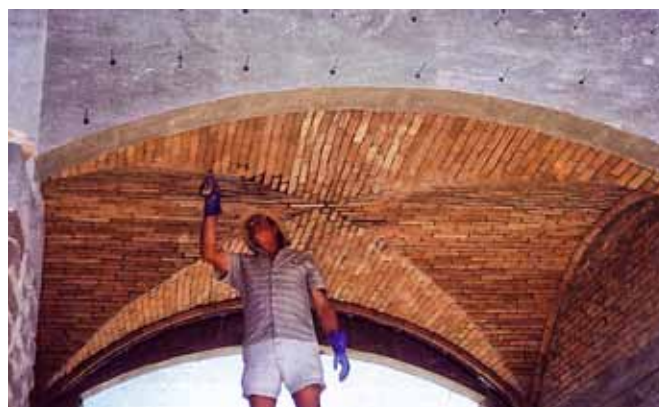
Spárování cihlové klenby – firma Šefl, s.r.o.