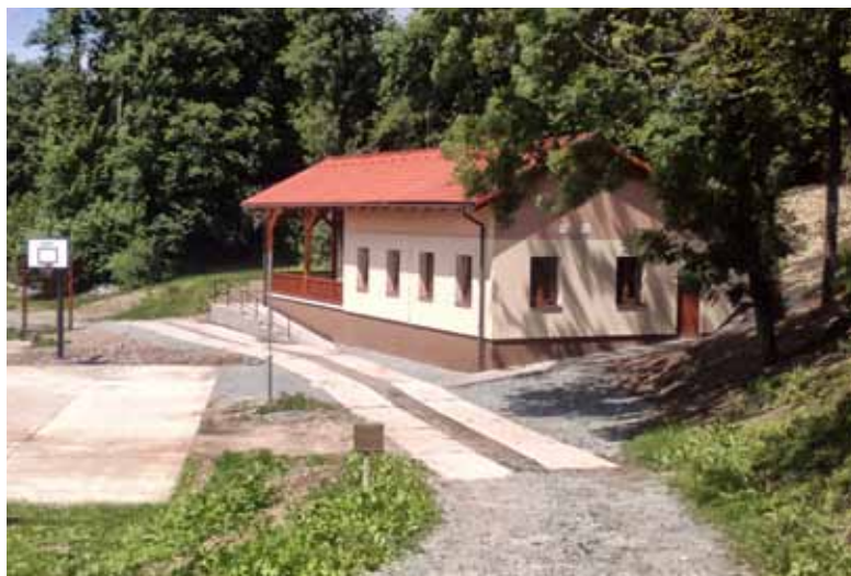
Stavba klubovny Spy, projekt realizovalo Nové Město nad Metují.