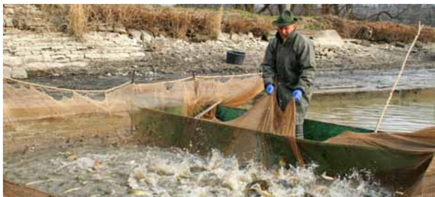
Ryby z Podhůří Orlických hor – Kolowratské rybářství, výlov rybníku v Opočně.